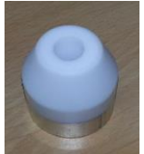
nozzle round 30mm