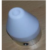
nozzle round 20mm