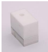
Schweißschuhrohling Typ 1 – 30 x 50mm Typ 2 – 40 x 52mm Typ 3 – 90 x 70mm