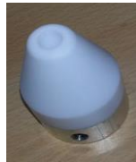
Schweißschuh rund 20mm