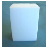
PTFE - Block