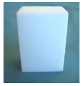
PTFE - Block