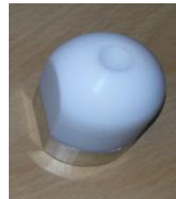
Schweißschuh rund 40mm