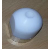
nozzle round 40mm