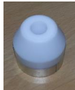
Schweißschuh rund 30mm